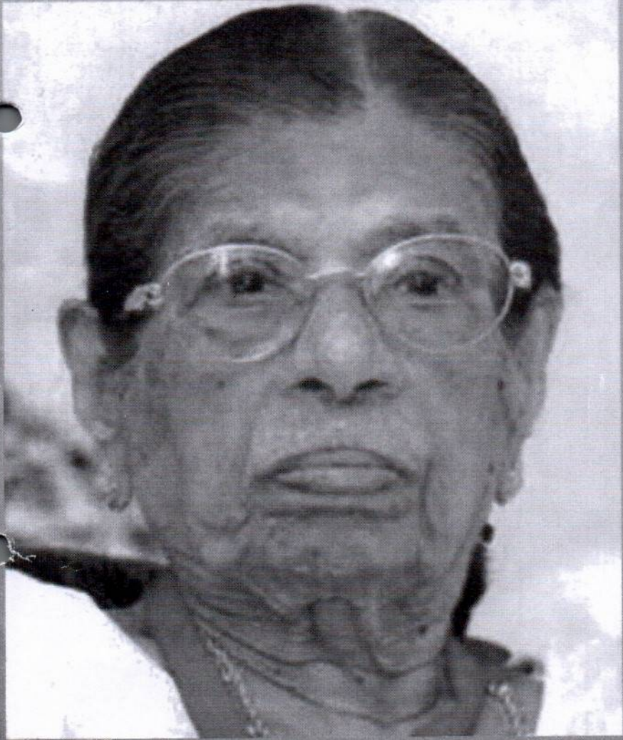
के. आर. गौरी अम्मा १९१९-२०२१