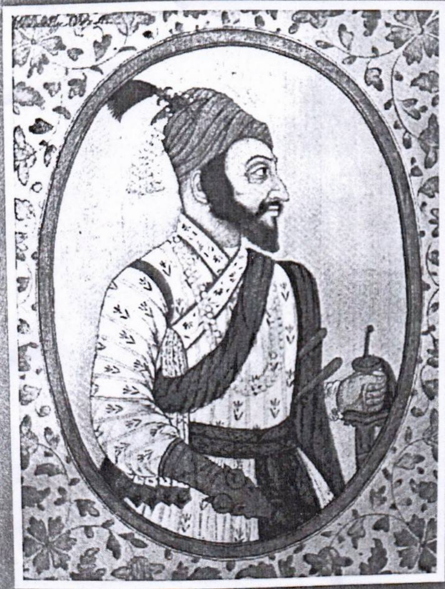
कुळवाडीभूषण छत्रपती शिवाजी महाराज विशेषांक